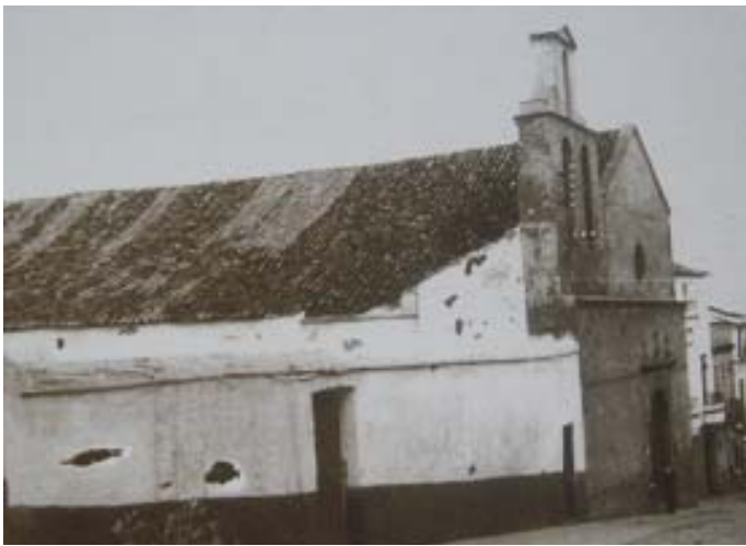
Convento e Iglesia de la Victoria a mediados del siglo XIX